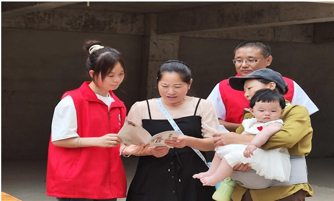
图 2-4：志愿者深入社区开展健康知识普及与教育