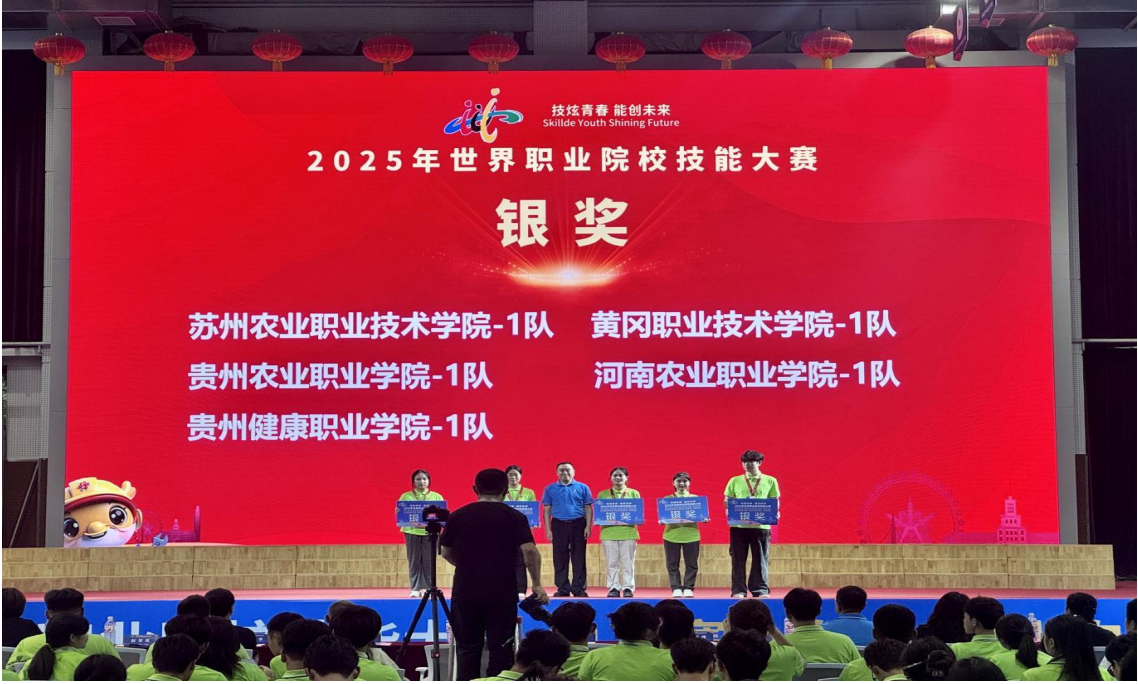
图 1-24：学生在 2025 年世界职业院校技能大赛总决赛上领奖

成效： 师生在 2025 年世界职业院校技能大赛总决赛现代农业赛道（高职组）中勇夺银奖，创下学院国家级一类技能大赛最佳成绩。赛事成果验证了“以赛促改、以赛促教、以赛促学”教学改革的有效性，推动实践教学与行业标准精准对接，学生专业技能与综合素养显著提升。该案例为学院技能人才培养提供了可复制、可操作的实践范本。