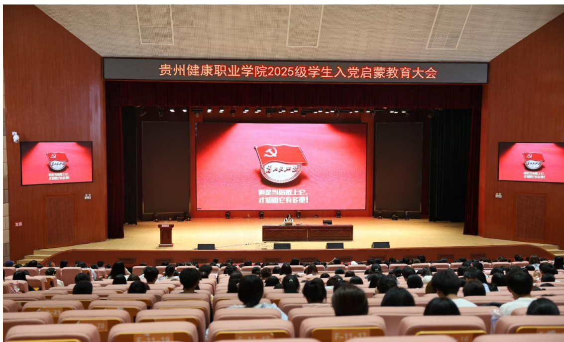
图 1-1：学院开展学生入党启蒙教育大会

成效： 2025 年发展学生党员 52 名、预备党员转正 40 名，党员队伍结构持续优化。学生党员及入党积极分子技能竞赛获奖率达 88%，专升本上线率 100%、应征入伍率 90%，毕业生党员高质量就业率 100%，形成育强学生党员、带动学生群体的良好效应。学院构建的发展学生党员全链条工作机制，贯通储备、培养、提升各环节，有效增强了高职院校发展学生党员工作效率，提升了党员队伍工作质量。