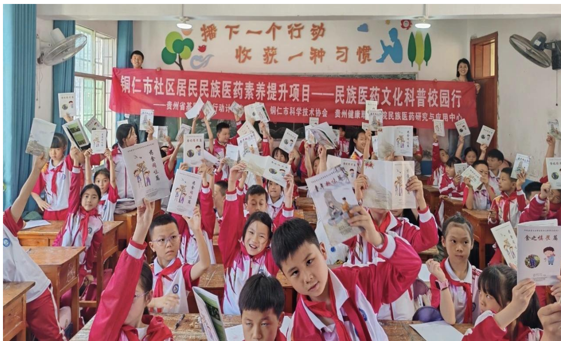
图 3-4：民族医药研究中心开展中医文化进校园活动

1. 品牌活动激发文化活力。举办“厚生之光·筑梦健康”文艺晚会，集体舞《万疆》、诗朗诵《青年奔赴·扬帆起航》等节目展现传统文化与青春梦想的交融。健康管理系举办弘扬中华优秀传统文化朗诵比赛，诵读《读中国》《中华颂》等经典作品，覆盖学生 300 余人次。