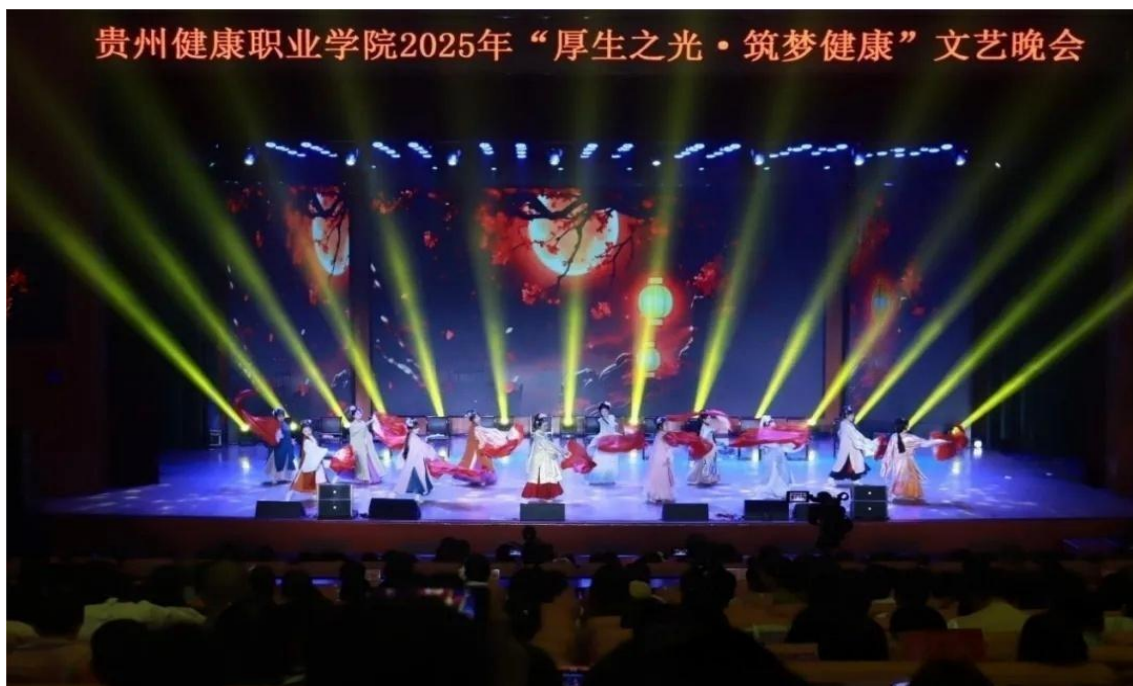
图 3-6：贵州健康职业学院 2025 年“厚生之光·筑梦健康”文艺晚会