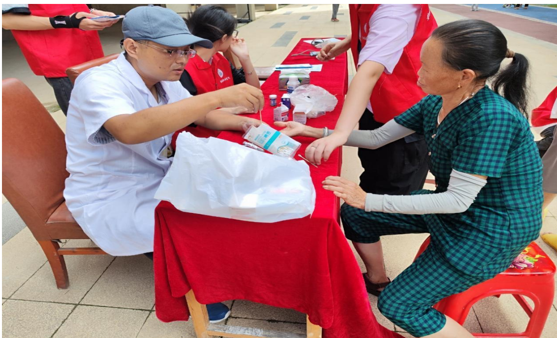
图 2-3：志愿者为社区居民检测健康指标

成效： 活动以中医药文化宣传、传染病防治科普与健康便民服务为核心，将专业医疗知识与贴心服务送到群众身边，有效提升了居民健康认知与自我保健能力，让健康关怀切实落地见效。