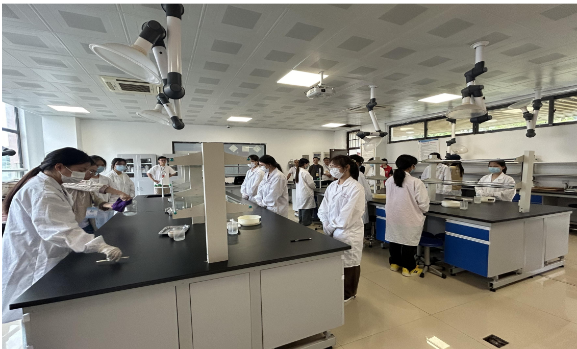
图 1-13：“双证书”实操考试现场