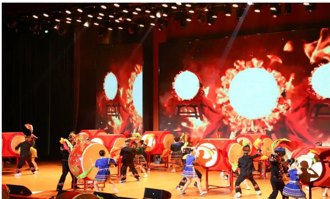
图 3-2：“厚生之光·筑梦健康”文艺晚会