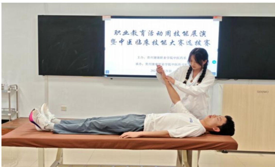
图 3-1：学院开展中医技能选拔赛

1. 产教融合深化技能培养。民族医药研究与应用中心依托铜仁市民族医药研究传承基地，开展“了不起的中药”科普短视频创作大赛、药用植物标本大赛及传统中药技能竞赛，覆盖师生 800 余人次，推动民族医药技艺传承与专业实践结合。康养系联合仁康养老服务公司设立“教师企业实践流动站”，开展心肺复苏、噎食急救等专项技能培训，累计培训养老机构职工 200 余人次，将专业技能转化为服务社会的“硬实力”。