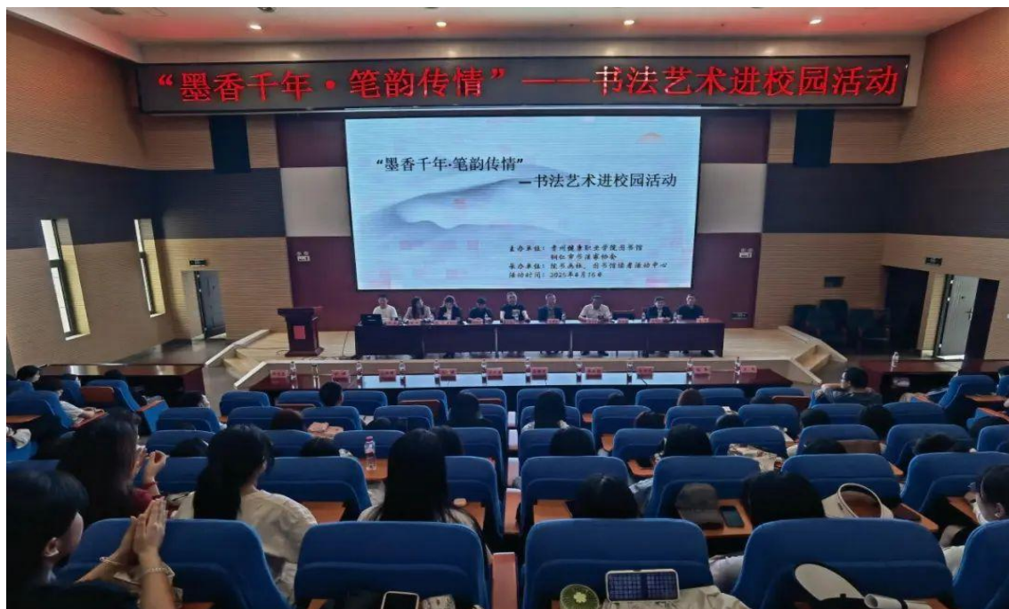
图 1-15: “墨香千年·笔韵传情”书法艺术进校园活动