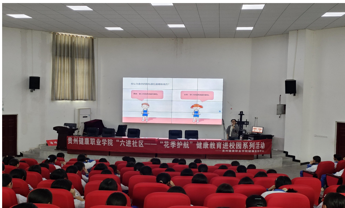
图 2-5：开展校园培训服务活动