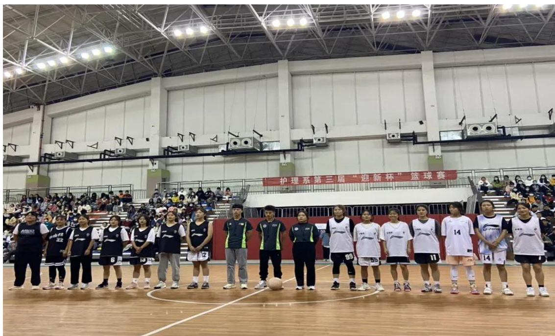
图 1-19：护理系“迎新杯”篮球赛现场