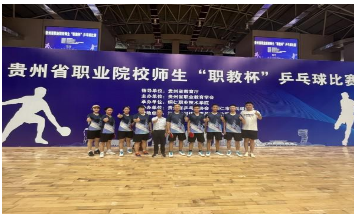
图 1-20：贵州省职业院校师生“职教杯”乒乓球比赛现场