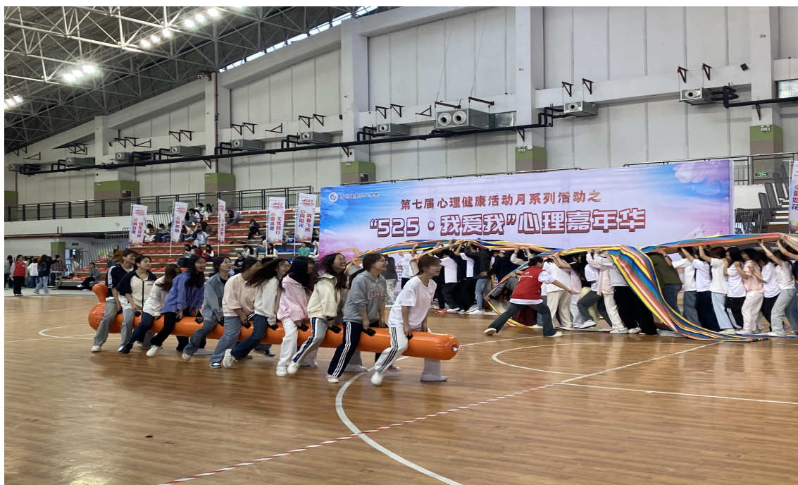
图 1-14：五·二五大学生心理健康节系列活动

四级心理健康网络工作体系，构建学生心理健康教育、实践活动、咨询服务、预防干预和家校协同“五维一体”的心理健康教育工作格局。面向全体新生开设心理健康教育课程，开展“5.25 心理健康教育月活动”等形式多样、寓教于乐的心理健康教育活动，建立线上线下常态化心理咨询服务体系，面向全体大学生开展个体咨询和团体心理辅导，做好学生心理危机预防、识别、预警、研判、干预及应急处理等工作，助力学生健康成长。