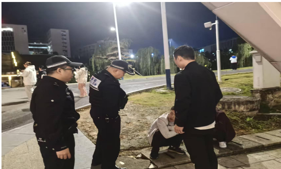
图 6-2：抓获 3 名企图非法入校人员移交公安机关