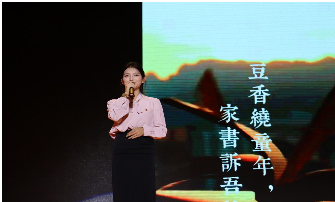
图 1-6：学生在报告会上分享家书

生感恩意识、责任观念与人生规划能力，推动思政教育“入脑入心”。该模式以情感为纽带、以叙事为载体，为高校思政工作提供了可复制、可推广的“情感+思政”实践范式。