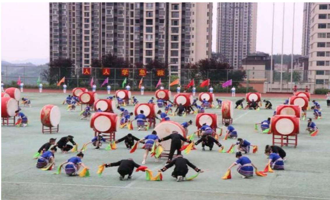
图 1-27：学生表演苗岭四面鼓

成效： 该实践是学院推动“五育并举”从理念到行动的一次成功转化，学生体质、技能与文化素养同步提升；为非遗项目搭建了校园传承平台，吸引青年学子成为新生代传承人；形成的“体美融合”模式已成为区域文化育人名片，为同类院校提供了可推广的“贵健院方案”。