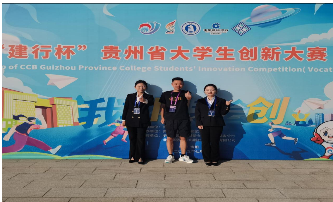
图 1-23：中国国际创新大赛指导教师与学生合影