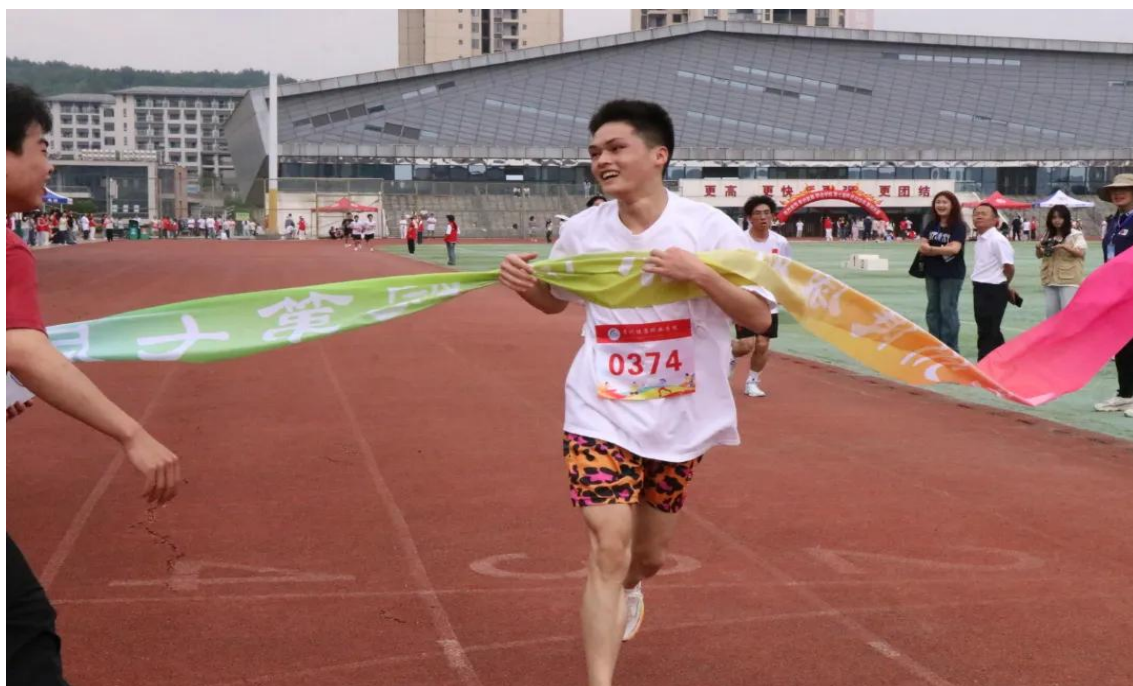
图 1-17：学生参加田径运动会