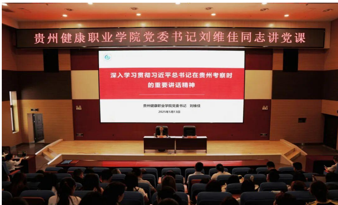
图 1-2：党委书记为党员师生讲授专题党课

1. 矢志不渝坚持党的领导，紧紧把握高质量发展的前进方向。一是学院党委始终把政治建设摆在首位。坚持加强党对学院工作的全面领导，强化政治功能，履行政治责任，切实做到“六个过硬”。严格落实党委领导下的校长负责制、民主集中制，以及集体领导和个人分工负责相结合的制度。以坚强政治引领筑牢办学治校根基。坚持“第一议题”抓学习、“第一遵循”抓贯彻、“第一政治要件”抓落实，深入学习贯彻党的二十大和二十届三中、四中全会精神，坚定拥护“两个确立”、坚决做到“两个维护”。坚持不懈落实党委领导下的校长负责制。二是学院强基固本，夯实高质量发展的动力根基。坚持以强化政治功能、提升组织力为重点推动基层党组织建设，推动