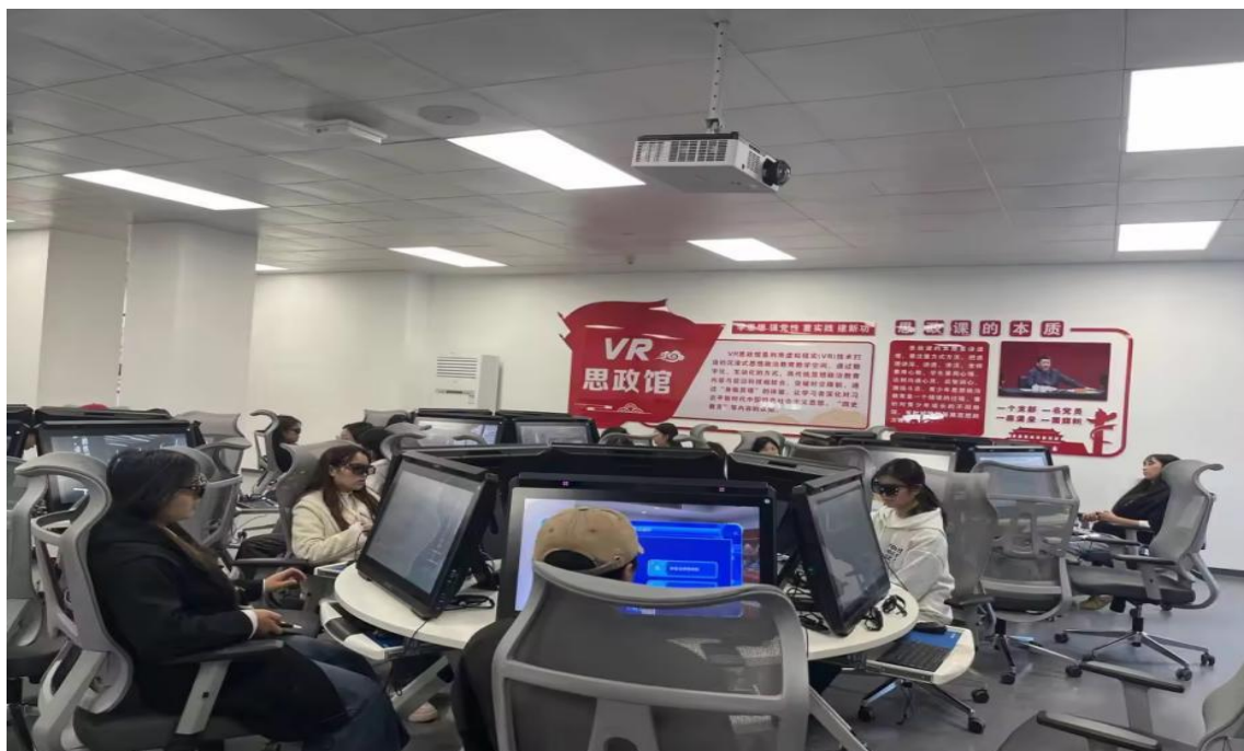
图 1-26：学生在虚拟仿真实训中心体验沉浸式思政课堂