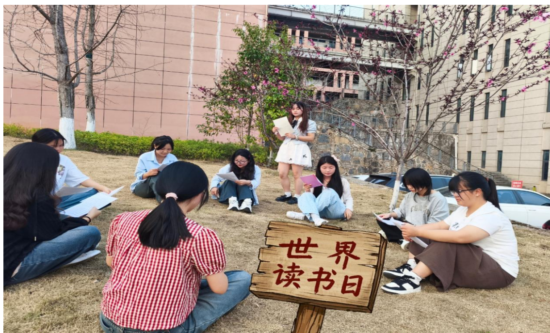
图 1-16: “一人一书一心得”活动现场