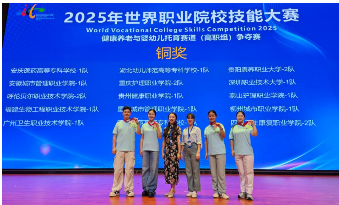
图 1-25：世界技能大赛颁奖现场