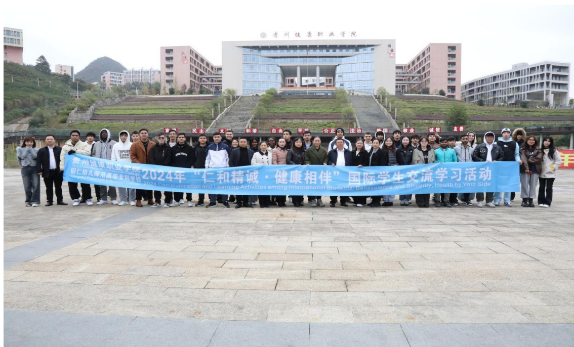
图 4-3：“仁和精诚·健康相伴”国际青年学生交流学习活动

成效： 国际青年体验贵州多彩文化、展现贵州生态文明建设新成绩、解锁地方高校产教融合文化育人新模式、观摩贵州乡村振兴的新局面，共同书写“一带一路”上的文明对话。