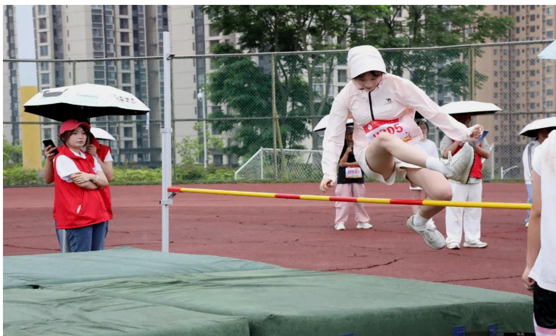
图 1-18：学生参加跳高比赛现场