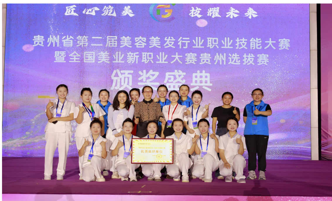
图 5-3：健康管理系师生参加贵州省第二届美容美发行业职业技能大赛 合影

勇夺 3 个一等奖、2 个二等奖、3 个三等奖，获奖率 100%。荣誉背后，是校企双元育人的深度实践，是“项目浸润”教学改革硬核实力，更是医学美容技术专业精准服务医美产业、持续输出高素质技术技能人才的生动示范。