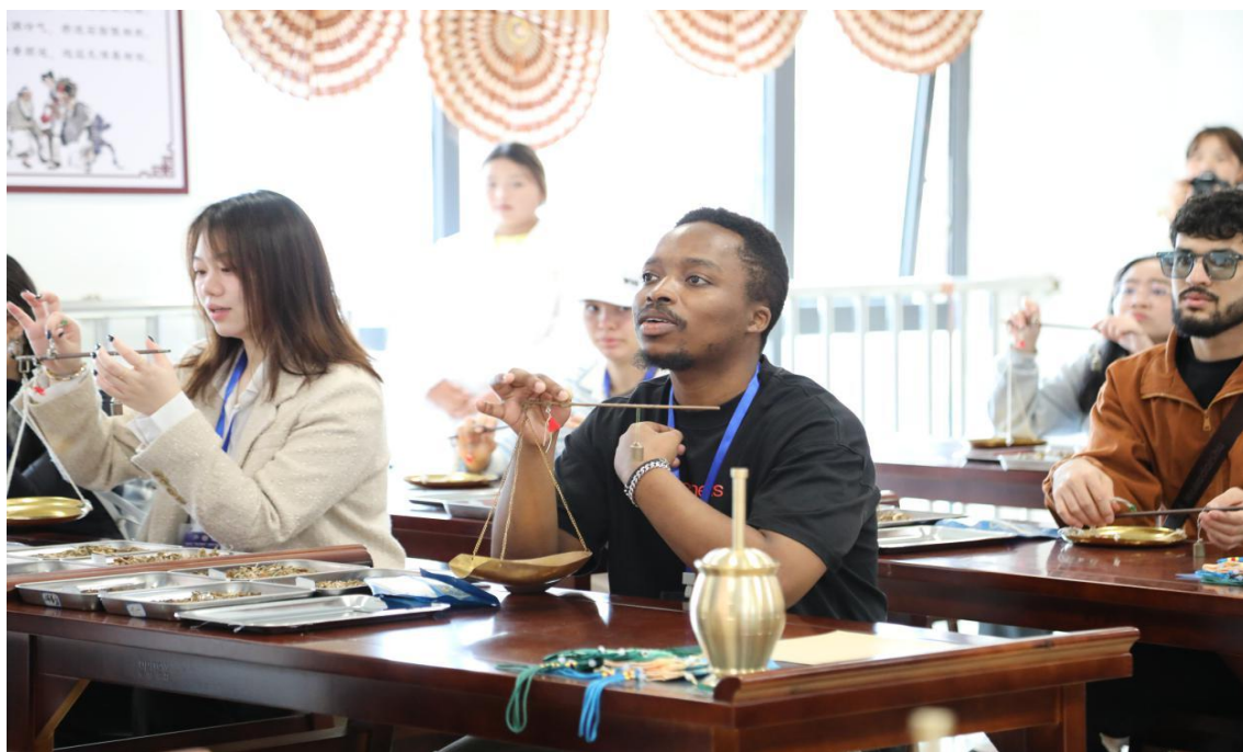
图 4-4：国际青年学生学习中药材抓取

学生教学活动，零距离感受黔东民族文化、黔东中医药文化、中华优秀传统文化，一定程度达到了让更多国际青年知晓贵州、爱上贵州、了解铜仁的效果。三是中文+健康，提高了学生跨文化交际能力，搭建中外青年交流桥梁。学院以“中文+健康”课程为主线，组织了中外青年国际文化交流展演等文化交流活动，进一步推动文化交融、民心相通，加深了国际学生对中华文化的了解和认识，促进了中外青年之间的相互了解，彼此之间建立深厚友谊，为中外青年的友好交流打下了坚实的基础。