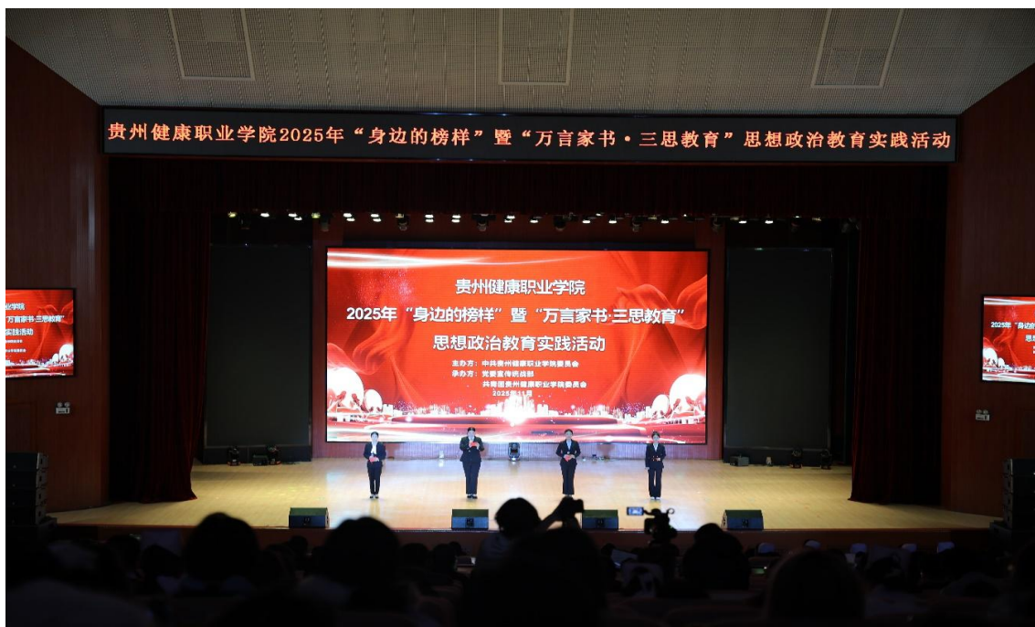
图 1-5：2025 年学院“身边的榜样”暨“万言家书·三思教育”报告会现场