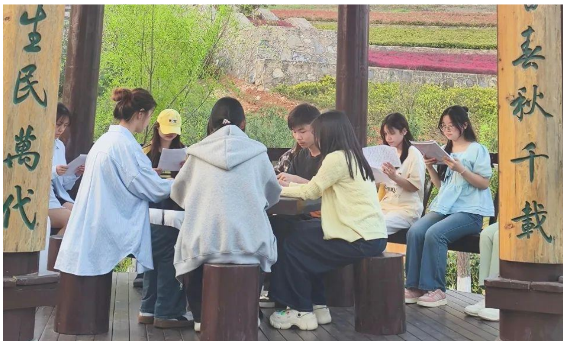
图 1-8：开展“书香校园”系列阅读推广活动