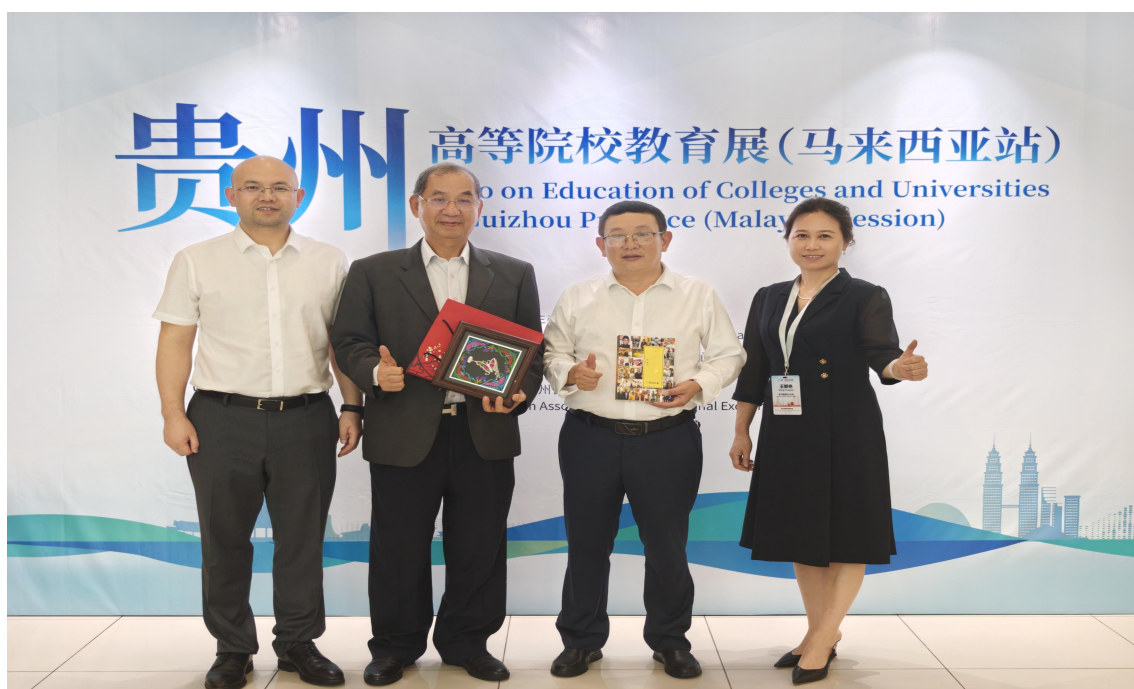
图 4-1:2025 年学院赴泰国、马来西亚开展留学贵州教育展

康相伴”国际学生交流活动等各类国际交流活动。通过这些活动，深入讲述铜仁故事，传播中国声音，显著提升了学院的国际知名度与影响力。2024 年，学院成功入选中北非国际教育创新联盟副理事长单位；2025 年，学院成功获批成为“一带一路”暨金砖国家技能发展国际联盟会员单位，同时成功获批列入“一带一路”职业教育产教联合体第一批成员单位。这为创新国际职业教育发展模式、发挥国际资源集聚效应、助力学院职业教育走向海外奠定了良好基础。