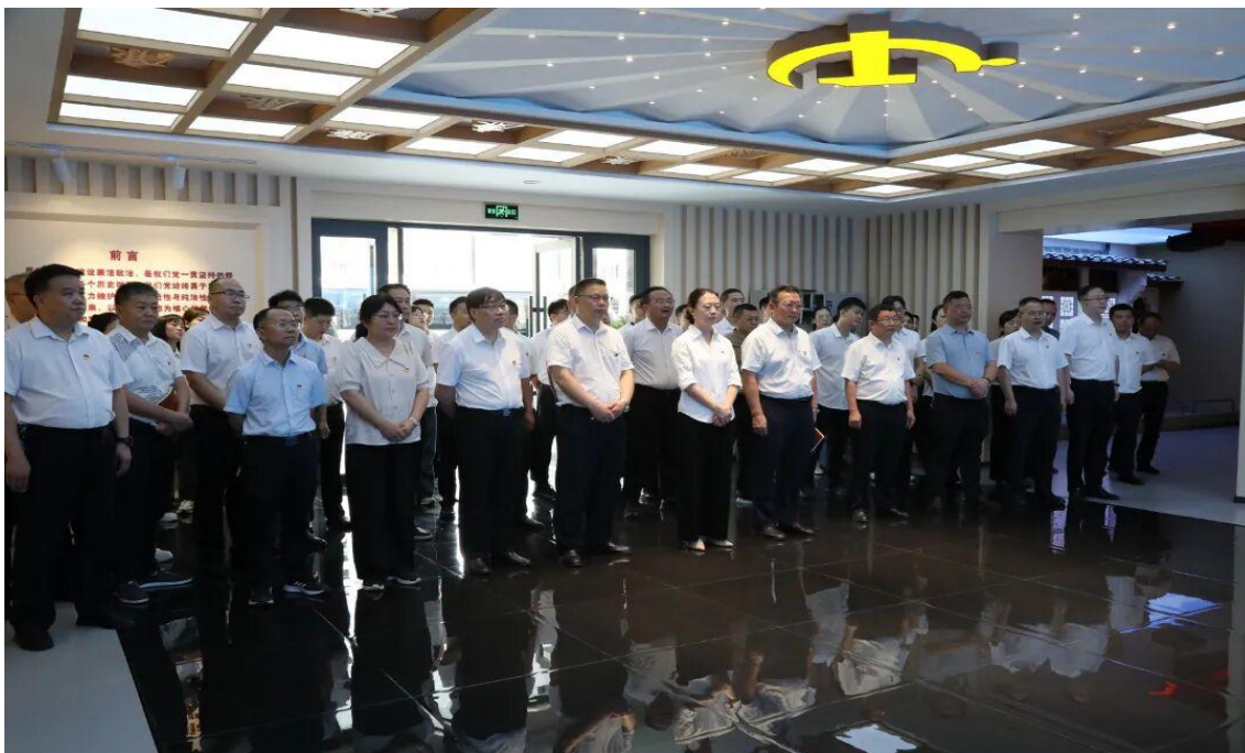
图 1-3：党委班子率队到碧江区党风廉政教育基地开展廉政警示教育活动