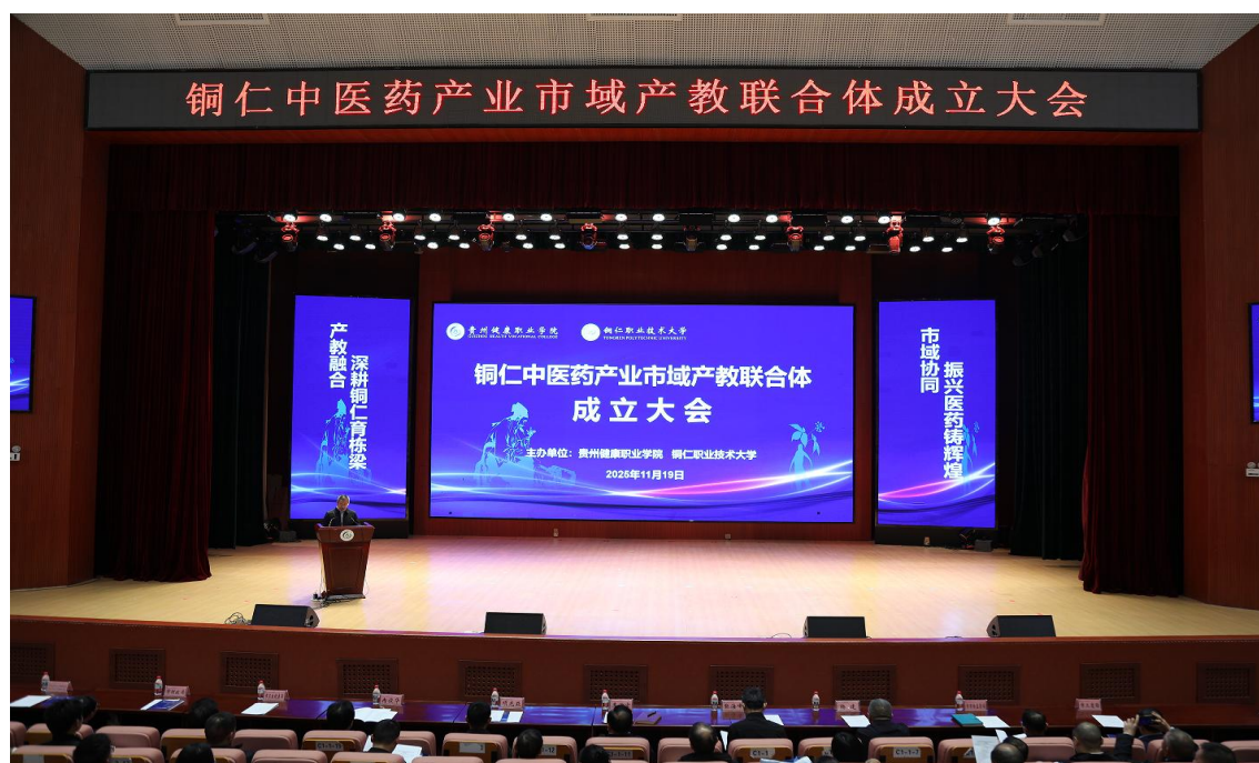
图 5-2：学院牵头成立《铜仁中医药产业市域产教联合体》

健康管理能力的技术技能人才。二是立足专业特色，创新开展多元协同育人新模式。2025 年学院与广东伊丽汇美容科技有限公司、同芙教育科技集团有限公司、苏州盛达药业有限公司、铜仁市中医院开展现代学徒制、订单班培养，现共计 44 人。三是立足校政企行资源优势，打造产教融合协同育人平台。2025 年 4 月召开铜仁市健康养老职业教育集团（铜仁市健康养老行业产教融合共同体）第二届理事会会议，新增 4 家企事业单位为理事单位，目前理事会单位共计 67 家；2025 年 11 月铜仁中医药产业市域产教联合体成立大会顺利开展，目前成员单位 77 家；积极参与行业产教融合共同体建设，2025 年申请成为全国中医药康养产教融合共同体、全国医护康养行业产教融合共同体理事单位。