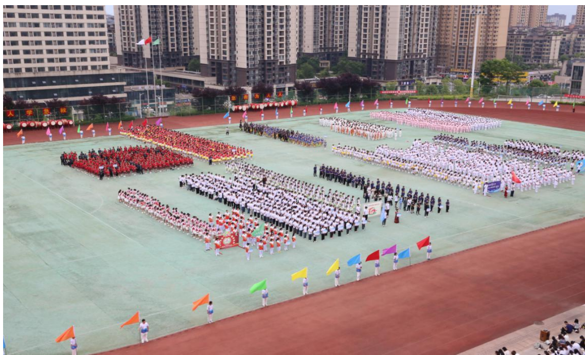
图 3-5：第七届田径运动会开幕式现场

3. 文化传播提升社会影响力。 党委宣传统战部通过官网、微信公众号等平台发布“双高”建设专题报道 30 余篇，其中《留学贵州·健康同行》留学生宣传片展现了中医药文化国际传播成果。中医药系推广八段锦，增强学生体质，提升身心健康水平，同时让学生在沉浸式体验中感受中医药文化的魅力，培养对传统文化的认同感和自豪感。康养系开展重阳敬老系列服务活动，通过艾灸、康复训练等专业服务，将尊老爱老传统美德转化为健康实践，让尊老之情在专业服务中落地生根，让健康之爱在实际行动中温暖人心。