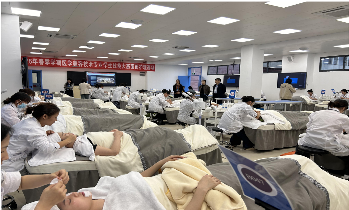
图 1-12：美容师职业技能等级认定实操考试现场