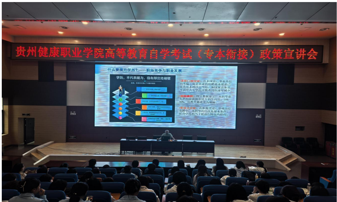
图 1-9：2024 年 9 月学院开展专本衔接政策宣讲会现场

二是校际协作持续深化，共育机制不断完善。学院积极拓展与本科院校的合作交流，2025 年 4 月与贵州医科大学继续教育管理中心开展专题调研，围绕课程衔接、题库共建、学生管理等关键环节进行座谈研讨。通过政策宣讲、对口交流等形式，促进两校在培养模式、教学资源等方面的深度融合，为专本衔接工作的可持续发展奠定了合作基础。