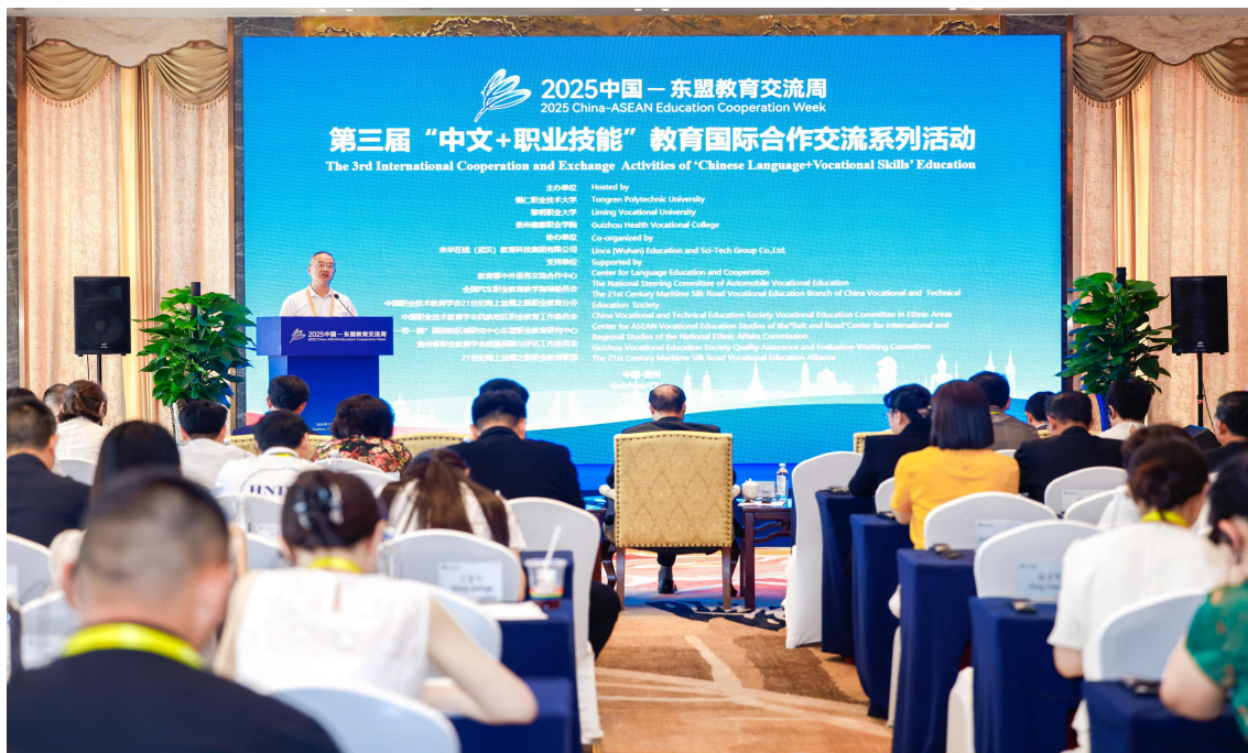
图 4-2：2025 年“中文+职业技能”教育国际合作交流系列活动