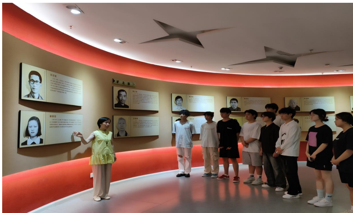
图 3-3：组织学生到万山汞矿博物馆开展传承红色基因现场教学

3. 实践基地拓展育人平台。 学院与万山汞矿工业遗产博物馆共建“大思政课”校级实践教学基地，组织师生参观工业遗址、聆听匠人故事、讲解“红色朱砂”爱国故事，通过沉浸式体验和实地调研，引导学生深入理解中国汞矿业史和“爱国汞”精神，增强历史责任感与文化自信，让青年学子在实践中传承红色基因，弘扬爱国主义精神。