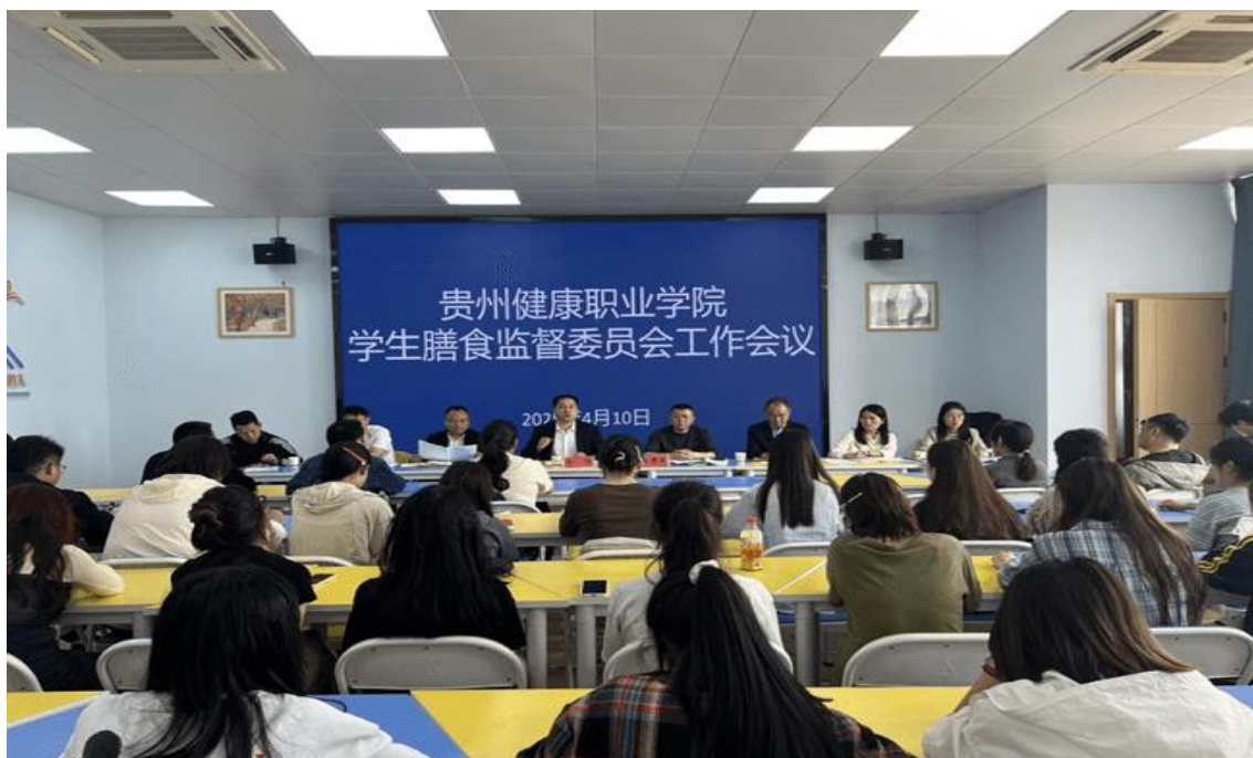
图 1-21：学生膳食监督委员会会议现场