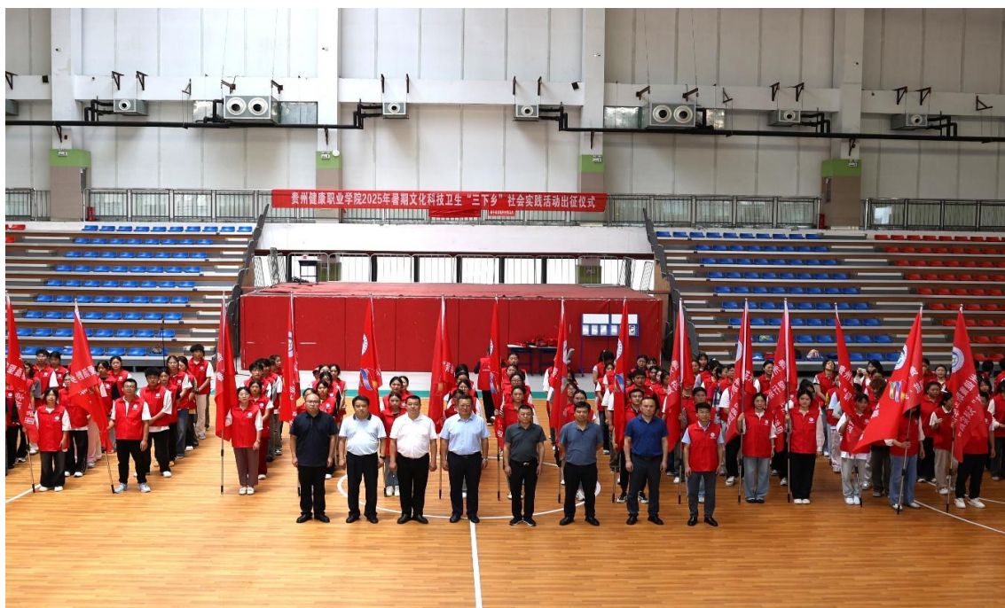
图 2-1：学院 2025 年暑期“三下乡”社会实践活动出征仪式

学院构建了“专业+社团+志愿项目”的运行模式，系统开发并长期运营“健康服务下基层”“7+e 禁毒防艾”“乡野青春·植药振兴”等 16 个牌子项目。通过建立“院-系-专业+社团”四级管理平台，实现项目发布、人员招募、过程管理、时长认证的全流程数字化管理。将暑期“三下乡”社会实践作为集中展示平台，围绕健康中国、乡村振兴等主题组建重点团队。