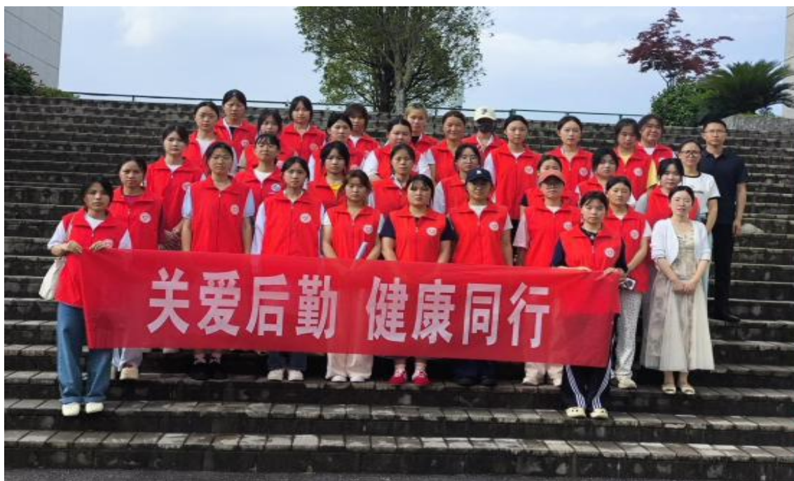
图 1-4：组织学生参加志愿服务活动