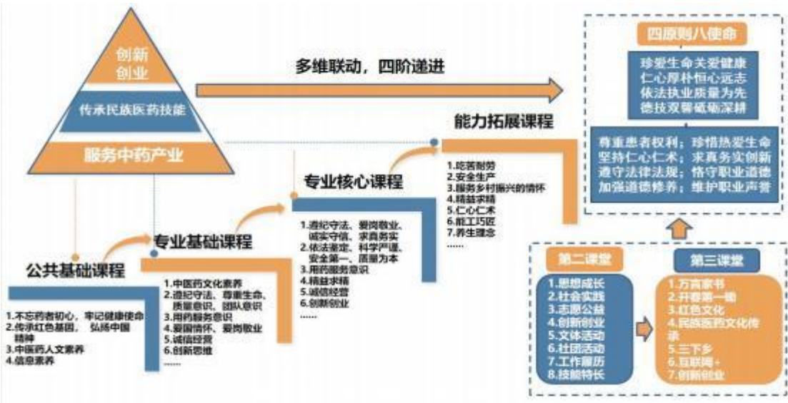
图3 “多维联动，四阶递进”思政育人体系

块来培养学生，在中药专业课程教学中充分运用思政教育资源，使思政教育春风细雨般融入专业课程中，从多个维度培养具“传承民族医药技能、创新创业、服务中药产业”的高素质中药学专业技术技能人才。围绕中药专业教学和思政教育同向同行协同育人，构建“多维联动，四阶递进”的思政育人体系全方位培养学生的职业素养。