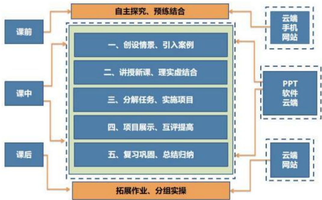
图2 “行动导向”教学模式

课堂实践，并紧紧围绕社会、中药企业的真实环境，任务的真实需求等，引导学生不断提高知识及技术技能水平。