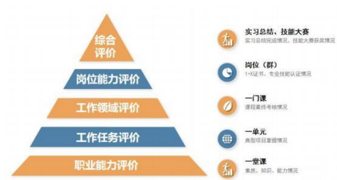
图 4 构建多维评价体系