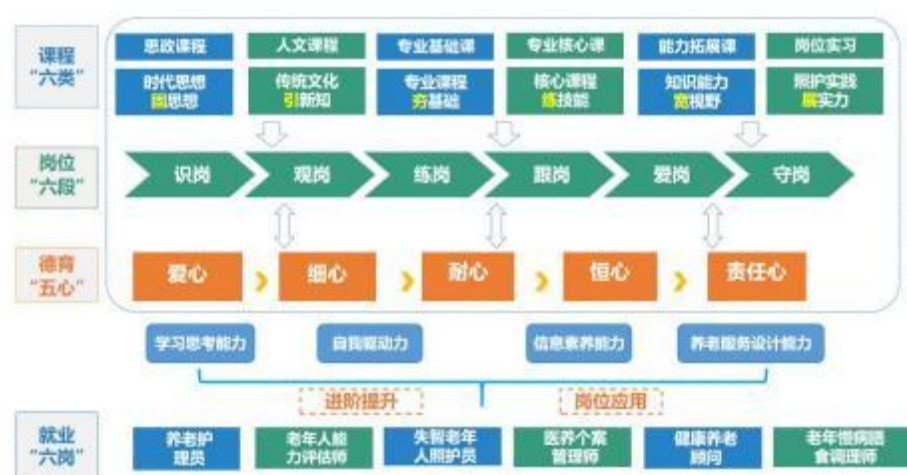
图 2: “德技双修·螺旋递进”思政教学体系

发展要求，应对医养结合、智慧养老政策导向，满足人民群众对幸福养老、普惠养老、个性养老的迫切需求，满足养老服务行业快速发展对管理效率更高、服务质量更优、人才素质更好的要求。培养的人才不仅要适应养老产业链中健康养老服务领域的核心技术岗位，适应“医养融合、居家·社区·机构一体化养老模式”转型发展的新业态就职岗位，还要能长期服务于广大失能、失智与慢病等重点老年群体，解决老年人生活照料、健康照护、能力康复、养生保健等最为迫切的养老服务问题。结合专业学生成长、行业产业发展、当前社会进步的需求，挖掘课程所蕴含的育人元素，逐步探索构建以课程为载体，以提升学生技能和职业道德素养为目标的课程思政教学体系，学生通过识岗、观岗、练岗、跟岗、爱岗、担岗六个环节，层层递进，锻造养老服务人才的高职业道德及职业素养。