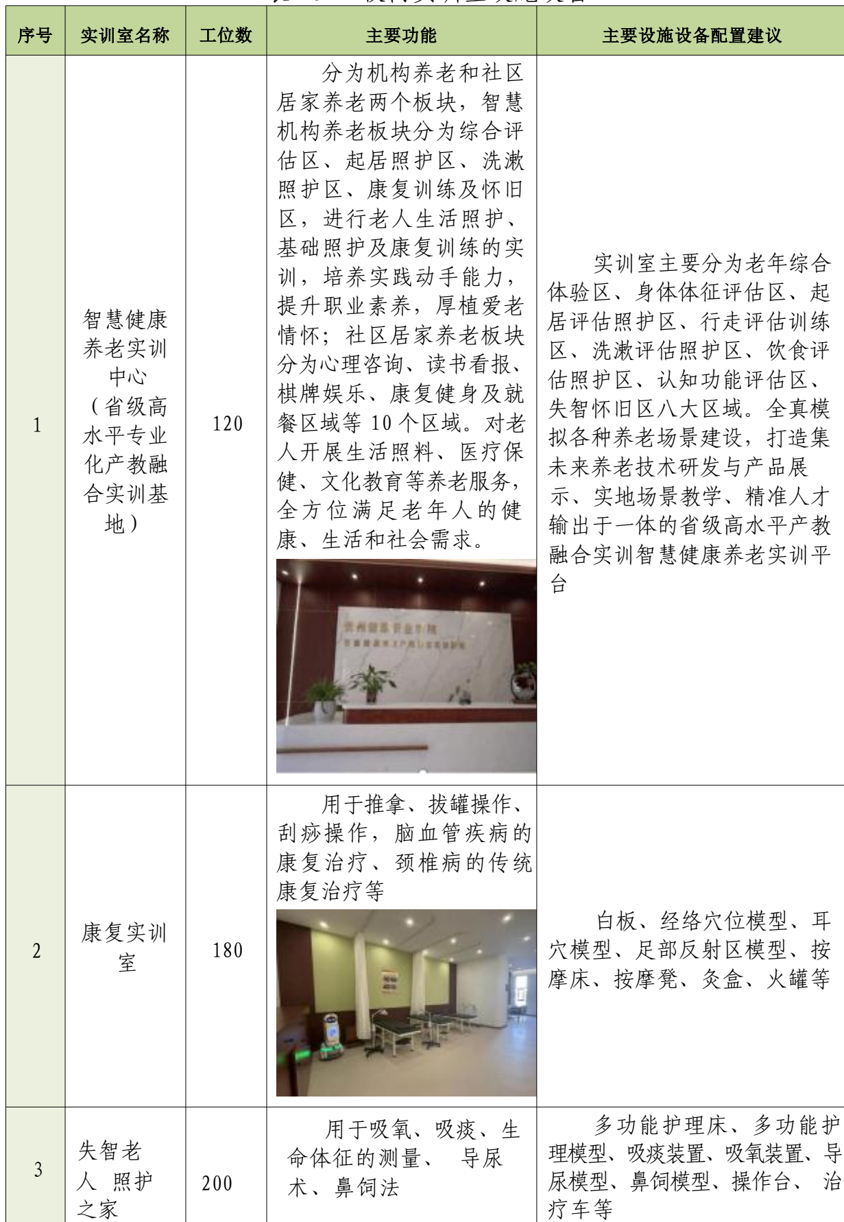
表 20 校内实训室设施设备