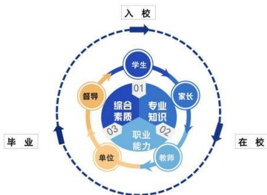
图 3: “三维度五主体全过程”教学评价体系

元化评价方式对生源情况、在校生学业水平、毕业生就业情况等进行分析，定期评价人才培养质量和培养目标达成情况。