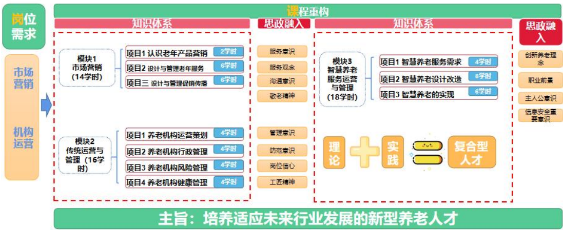
图 1 课程内容重

课程总计 48 学时，3 学分，其中 32 学时用于理论教学，16 学时用于实践教学。